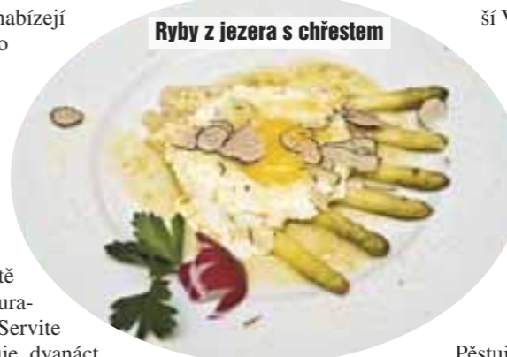
Ryby z jezera s chřestem

Pěstuje se v mnoha sva-hovitých oblastech provincie, v údolí Valle dei Laghi pak pro výrobu Vino Santo, které je sladké, připomíná tokajské výběry a v sudech musí zrát nejméně deset let.